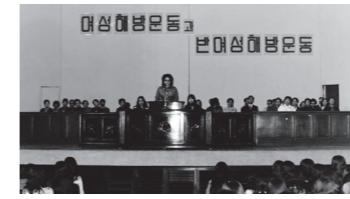
아시아 최초 여성학 강좌