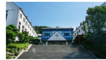
세계 최초 여성 공과대학, 법과대학

여성을 위한 공과대학과 법과대학을 설립함으로써 여성에 대한 선입견과 한계를 타파