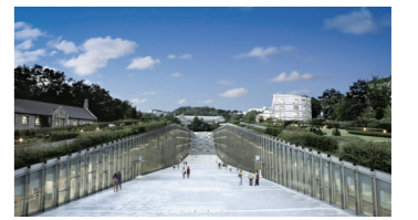
이화의 상징이 된 ECC

세계적인 프랑스 건축가 도미니크 페로가 설계한 국내 최대의 친환경 건축물 건립