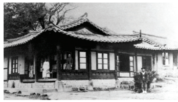
한국 최초의 여성전용 병원 보구녀관