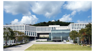
글로벌 연구 네트워크 인프라, 산학협력관