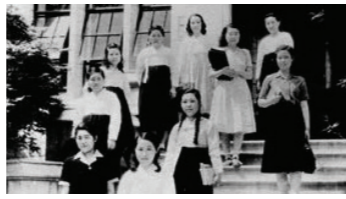
전문 교육 양성의 장, 여자대학원