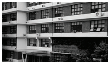
한국 최초 사립대 사범대학

한국전쟁의 환난 속에서도 어린 여성들의 인권과 교육을 위해 한국 최초 사립대 사범대학 설립