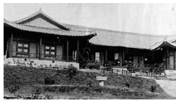
한국 최초 여성 교육 기관 이화학당

미국 북감리교 여선교부 선교사 메리 F. 스크랜튼 여사가 서울 정동 자택에서 한 명의 학생으로 수업 개시