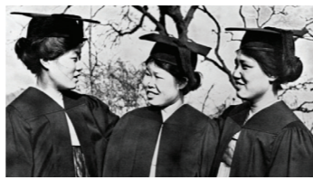
한국 최초 종합대학교

1946년 8월 15일 대한민국 최초로 종합대학교 인가를 받음 근대 교육의 새 지평을 열